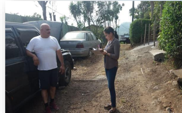
Calle Badilla, San Antonio, Alajuelita. Abril, 2020.