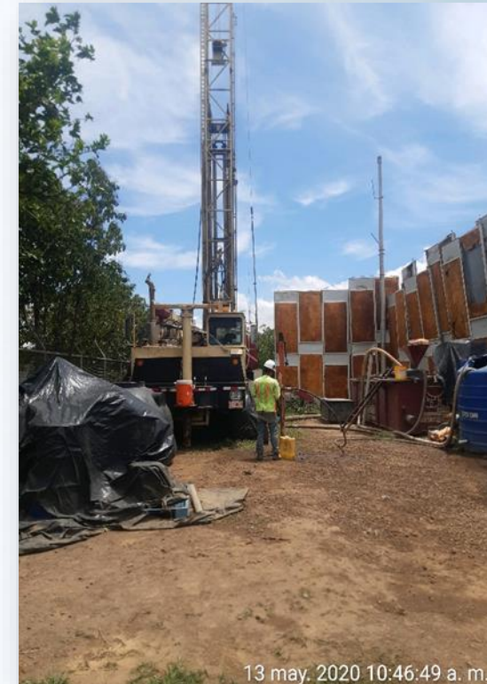
Proyecto Rehabilitación Pozo W-11. Mayo, 2020.