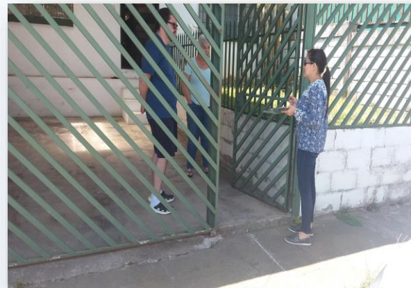
Residencial La Casa. San Vicente, Moravia. Abril, 2020.