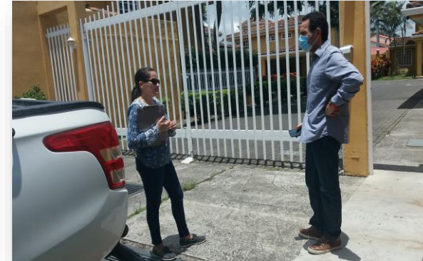
Condominio Jacaranda, San Vicente, Moravia. Abril, 2020.

Registro de afectaciones y valoraciones comunales, abordaje de consultas de población usuaria