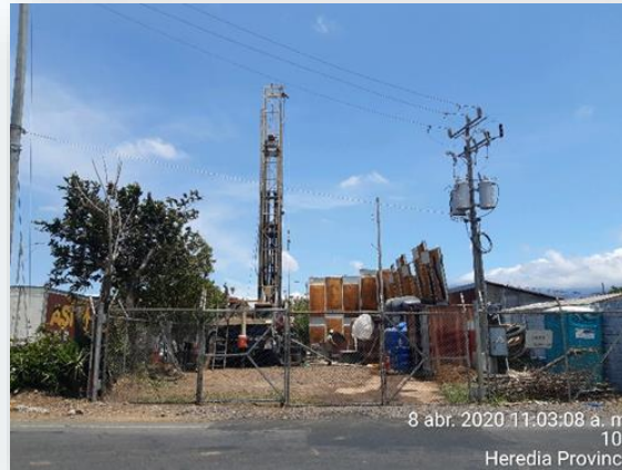
Proyecto Rehabilitación Pozo W-11, Abril, 2020.

Registro de valoraciones comunales sobre el proyecto y atención de consultas.