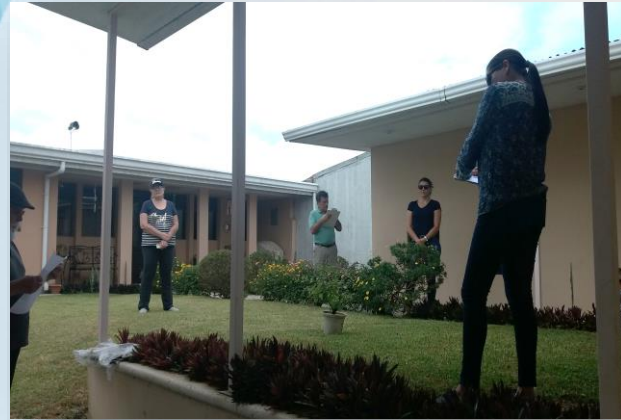
Barrio La Florencia, San Vicente, Moravia. Abril, 2020.