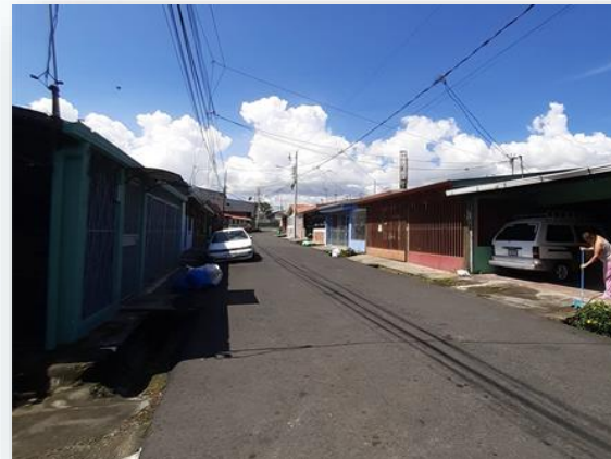
Proyecto Rehabilitación Pozo W-11, Barrio Lourdes. Junio, 2020.